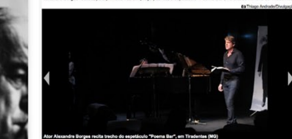
Alexandre Borges recita trecho do espetáculo "Poema Bar", em Tiradentes (MG)

Alexandre Borges recitou, pela primeira vez em praça pública, o espetáculo "Poema Bar", na cidade mineira de Tiradentes